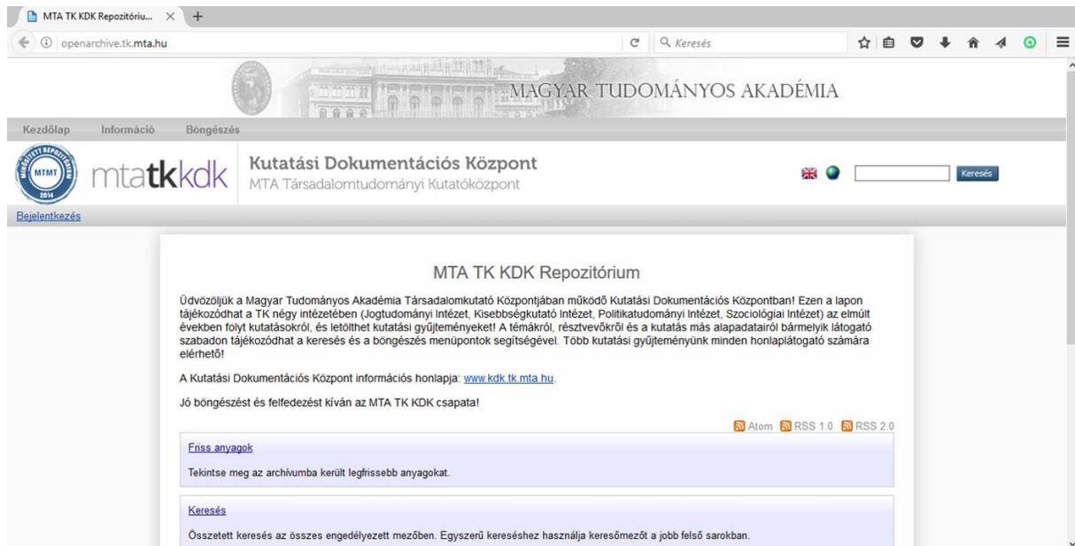
3. ábra A KDK Repozitórium honlapja

A repozitóriumban tárolt adatok két nagy csoportra bonthatók: